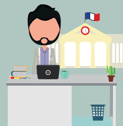
Point local d'informations

Étape 3 : Vous avez envoyé votre demande aux maisons de retraite qui vous répondent sur viatrajectoire.fr